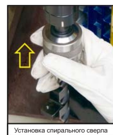
Установка спирального сверла